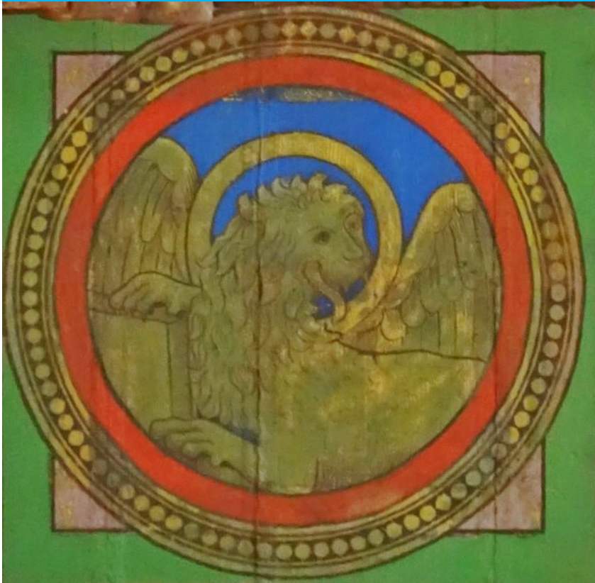
Foto von der Decke in der Vierung der Stiftskirche mit dem Löwen als Symbol für den Evangelisten Markus